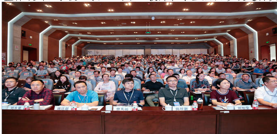
诊改工作培训会议

为了进一步加深教职工对诊改工作意义、内涵的认识，深入开展学校内部质量保证体系诊断与改进，质量管理处分类分批组织诊改专项组以及诊改工作牵头部门主要负责人，参加由全国“诊改专委会”组织的相关培训。8 月至今，质量管理处分 5 批组织 15 人参加“内部质量保证体系建设与运行实施方案编制”“诊改高级实务”等培训，培训内容包括诊改实施方案编制的基本理念、指导思想、目标任务，内部质量保证体系整体设计，学校、专业、课程、教师和学生层面诊改运行实务等。