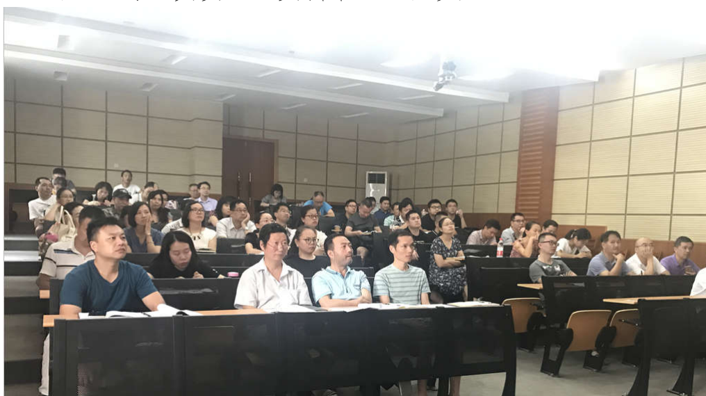
数据采集校内培训会

根据《关于做好2018年职业院校人才培养工作状态数据采集工作的通知》文件精神，学校于8月1日下午召开工作布置会，即日启动“2018年人才培养状态数据采集与管理平台”填报工作。为做好学校人才培养工作状态数据采集工作，质量管理处于8月3日召开填报工作培训会，各部门数据填报工作负责人、专职数据采集员，各二级学院（部）教学院长（主任）、专业负责人、实训中心主任参加。