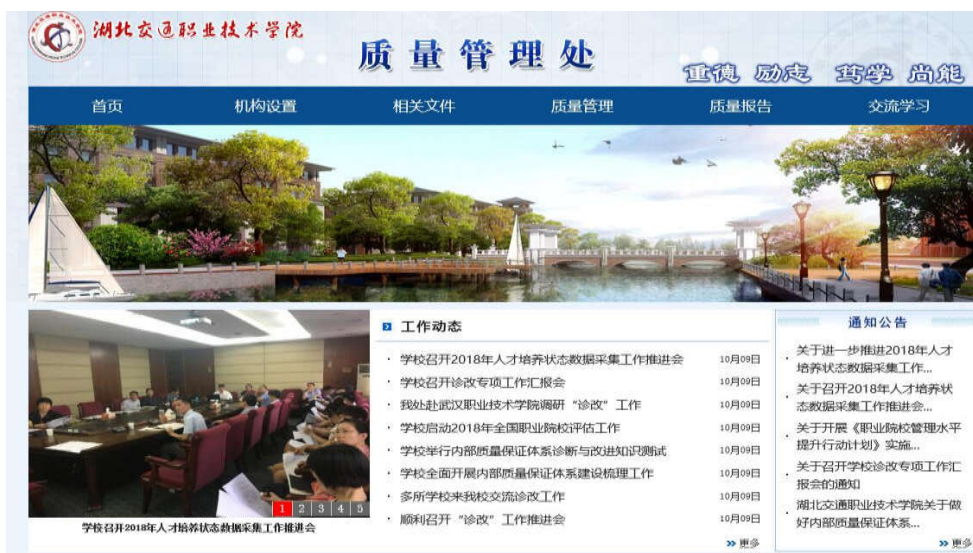
质量管理处网站首页

为进一步落实内部质量保证体系诊断与改进，促进学校质量管理工作，经过学校党委办公室批准，质量管理处联合信息中心，完成部门网站的设计，并指定专人负责网站运行和安全维护，网站于10月15日正式对外开放。网站包括通知公告、工作动态、交流学习等栏目，主要用于成果展示、任务通知、资料共享。网站的建立，有利于全校教职工更全面地了解学校“诊改”工作进展，更灵活地学习相关“诊改”知识，更深入地开展交流互动。