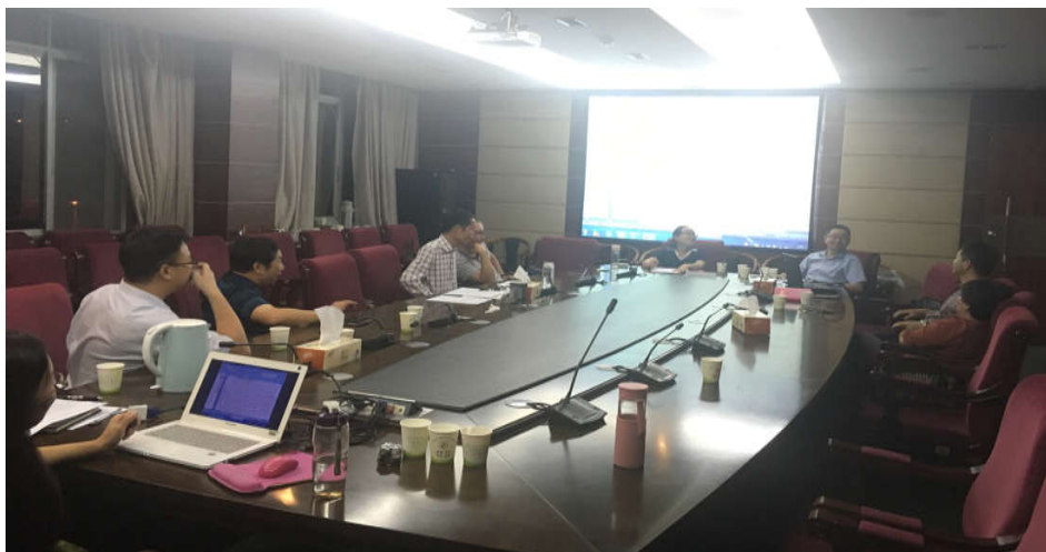
交通优质校申报材料集中审查之一

此次申报工作涉及学校办学的方方面面，各部门在思想上保持高度一致，紧密协调、统筹配合。申报期间分组研讨 30 余次，连续 7 天集中审核申报材料至深夜。平均年龄近 50 岁的专家组在定稿日更是通宵达旦，逐字逐句反复推敲，确保申报材料质量。经过 25 天的夜以继日，项目组终于在 9 月 30 日上报规定材料。