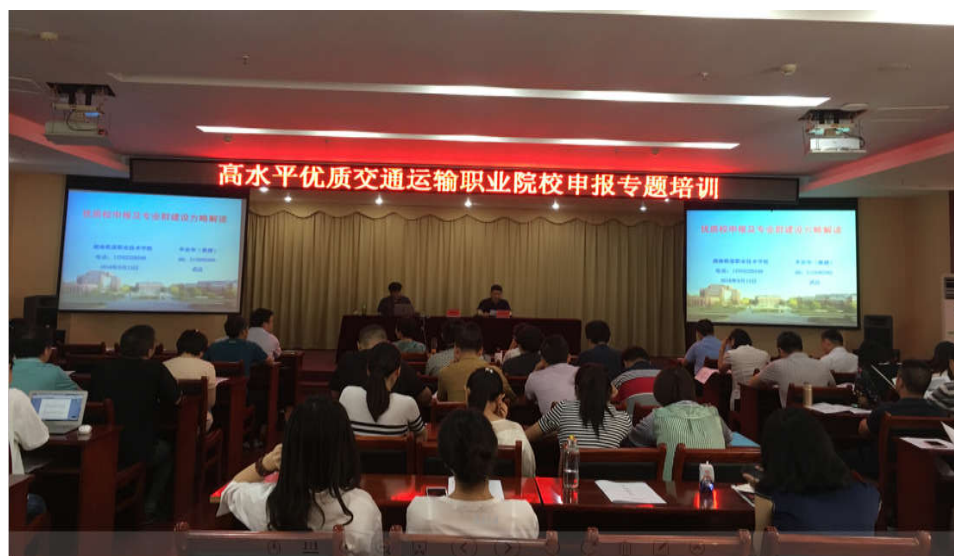
交通优质校申报专题培训

学校上下高度重视高水平优质交通运输职业院校建设单位遴选工作，经过深入分析研究，确定申报工作任务分工，于9月4日召开工作部署会议，对工作做出部署安排。